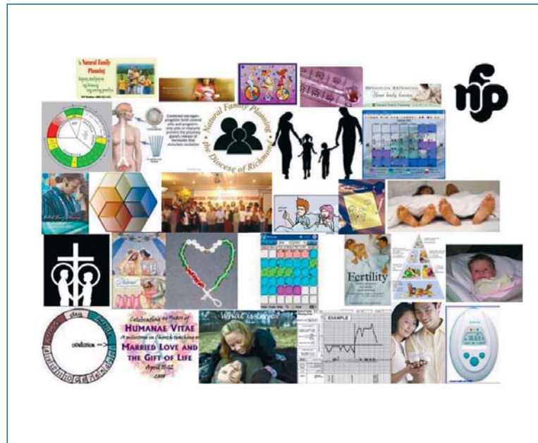
„So flaggt die Natürliche Familienplanung - Impressionen aus der internationalen Arbeit“

Die Bilanz der Tagung: mediales Lernen ist zwar die Zukunft, aber die individuelle Beratung wird dadurch nicht ersetzt, ganz im Gegenteil, der Bedarf an qualifizierter individueller Beratung wird dadurch sehr wahrscheinlich noch zunehmen.